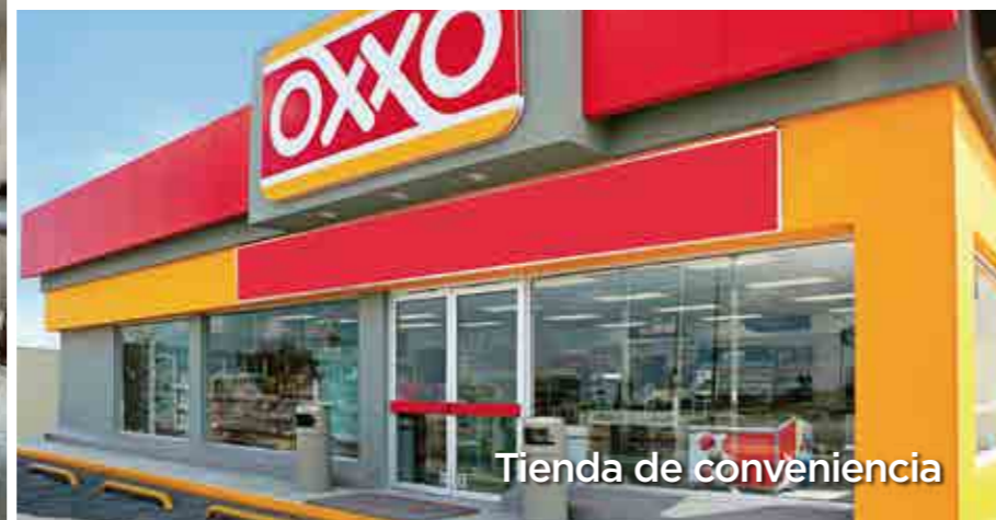
Tienda de conveniencia