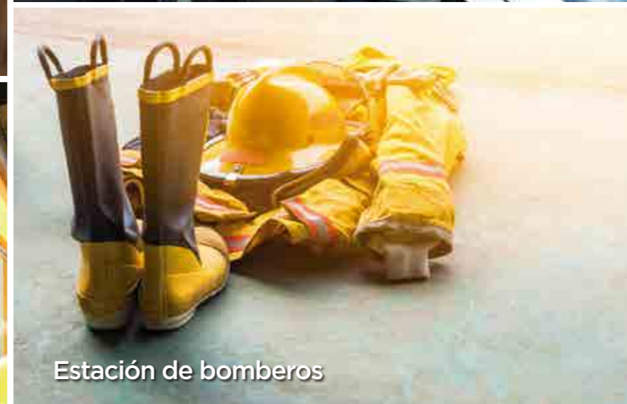
Estación de bomberos