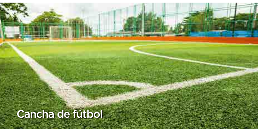
Cancha de fútbol